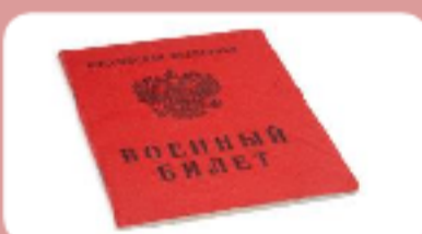
Военный билет (для заявителей мужского пола от 18 до 27 лет, проживающих на территории РФ)