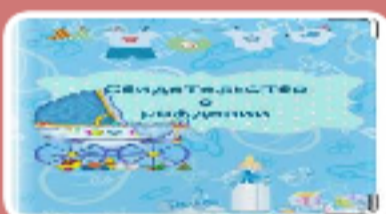
Свидетельство о рождении