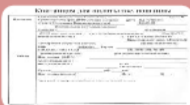
Квитанция об оплате госпошлины