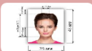
3 фотографии (3,5x4,5, матовые/цветные/черно-белые)